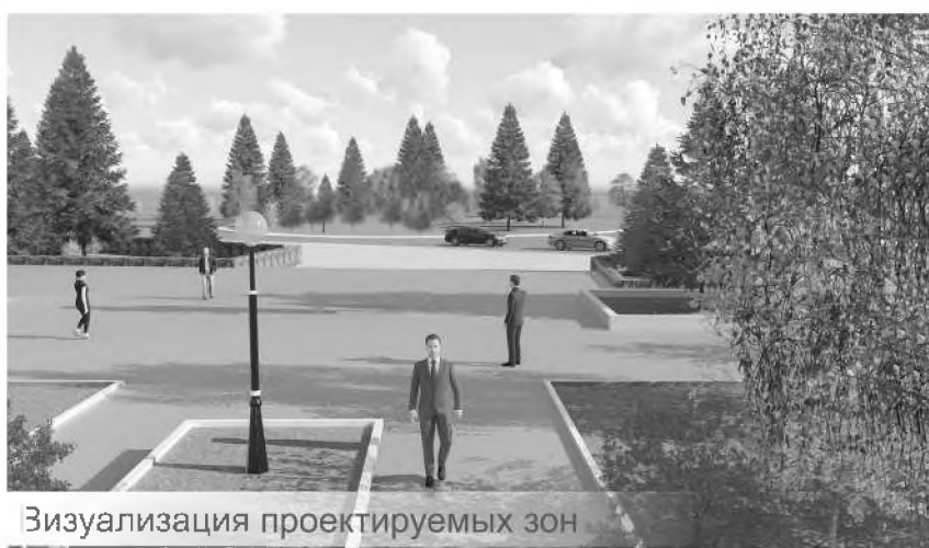
Визуализация проектируемых зон

Для людей пожилого возраста предлагаются игровые столы с лавочками (шахматы, шашки, нарды, карты), удобная мебель и освещение.